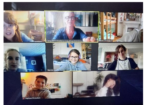
Le dernier cours en distanciel !!